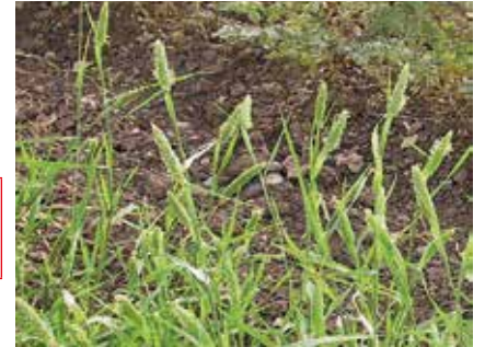
Yumuşak başaklı kuşyemi ( Phalaris paradoxa )