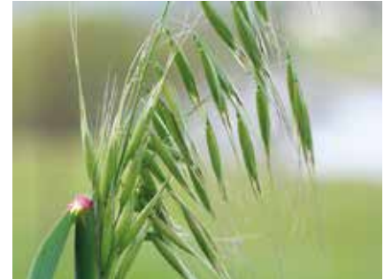
Yabani yulaf ( Avena fatua )