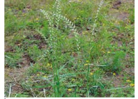
İngiliz çimi ( Lolium perenne )