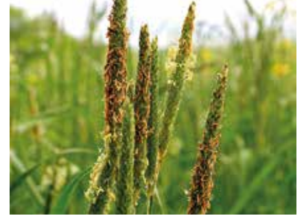
Tilkikuyruğu ( Alopecurus myosuroides )