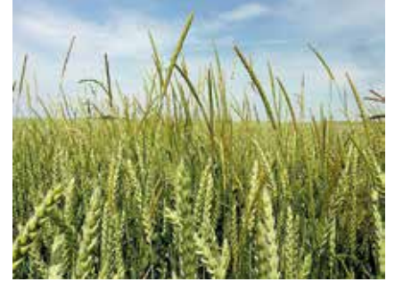
Tilkikuyruğu ( Alopecurus myosuroides )