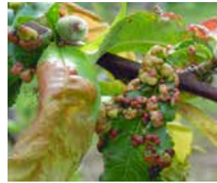
Yaprak Kıvrıklığı ( Taphrina deformans )

Tavsiye dozu üzerinden bitki koruma ürünü önce ayrı bir kapta bir miktar su ile karıştırılır. Uygulama makinesinin deposu yarı yarıya su ile doldurulur. Makinenin karıştırıcısı çalışır durumda iken karışım depoya ilave edilir. Karıştırmaya devam edilerek depo suyla tamamlanır. Uygulama tamamlanıncaya kadar karıştırma işlemine devam edilir. İlaçlama, günün erken saatlerinde veya akşam serinliğinde bitkinin her tarafı iyice ıslanacak şekilde kaplama ilaçlama olarak ve rüzgarsız havalarda yapılmalıdır.