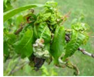
Yaprak Kıvrıklığı ( Taphrina deformans )