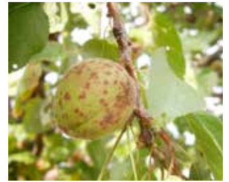
Yaprak Delen ( Wilsonomyces carpophilus )