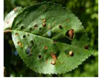
Yaprak Delen ( Wilsonomyces carpophilus )